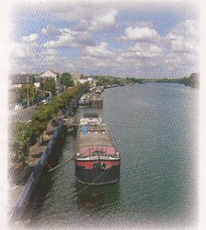
Juvisy, quai de l'industrie.

Nombreux hôtels dans la zone aéroportuaire d'Orly