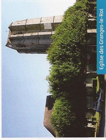
Eglise des Granges-le-Roi

5 Prendre à droite la rue de l'Air puis à gauche, la rue de la Fontaine. Dans le virage, prendre à