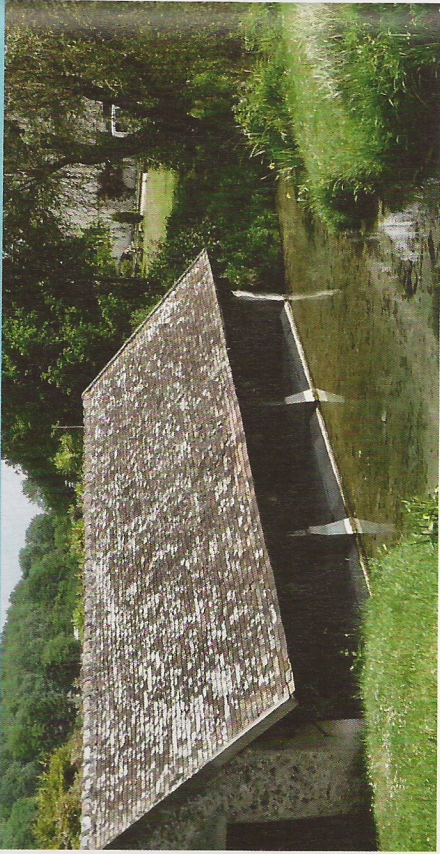
Un lavoir à l'entrée du village de Souzy-la-Briche.