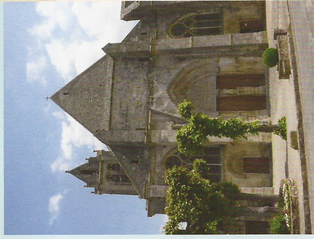
L'église de Saint-Sulpice de Favières.